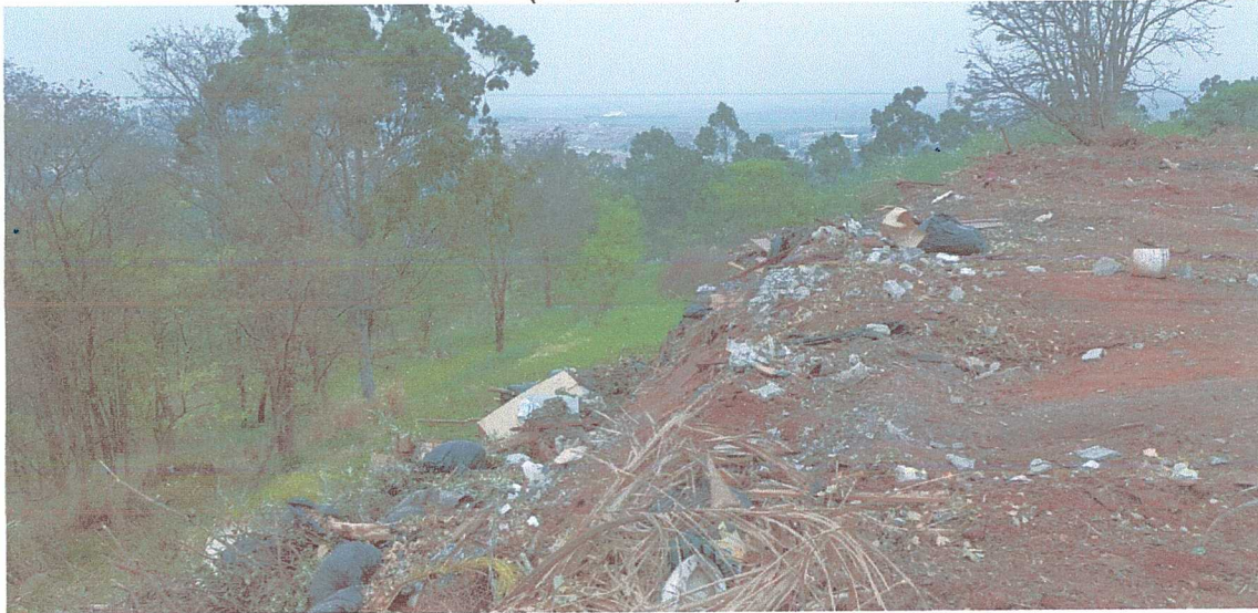
FOTO QUE DEMONSTRA CÓRREGO PROXIMO AO LIXO RCC E DOMÉSTICO